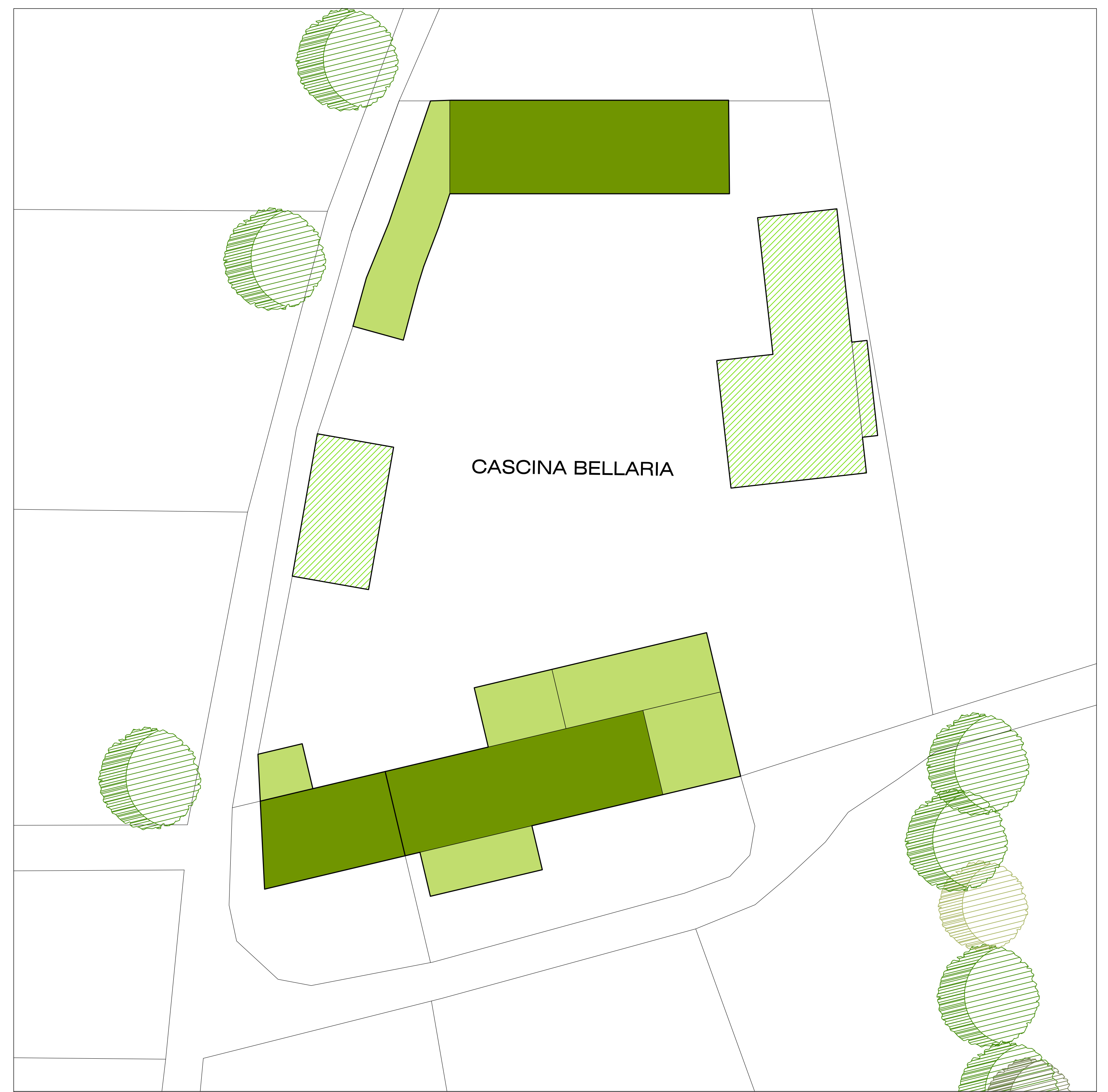
INDIVIDUAZIONE DESTINAZIONI D'USO