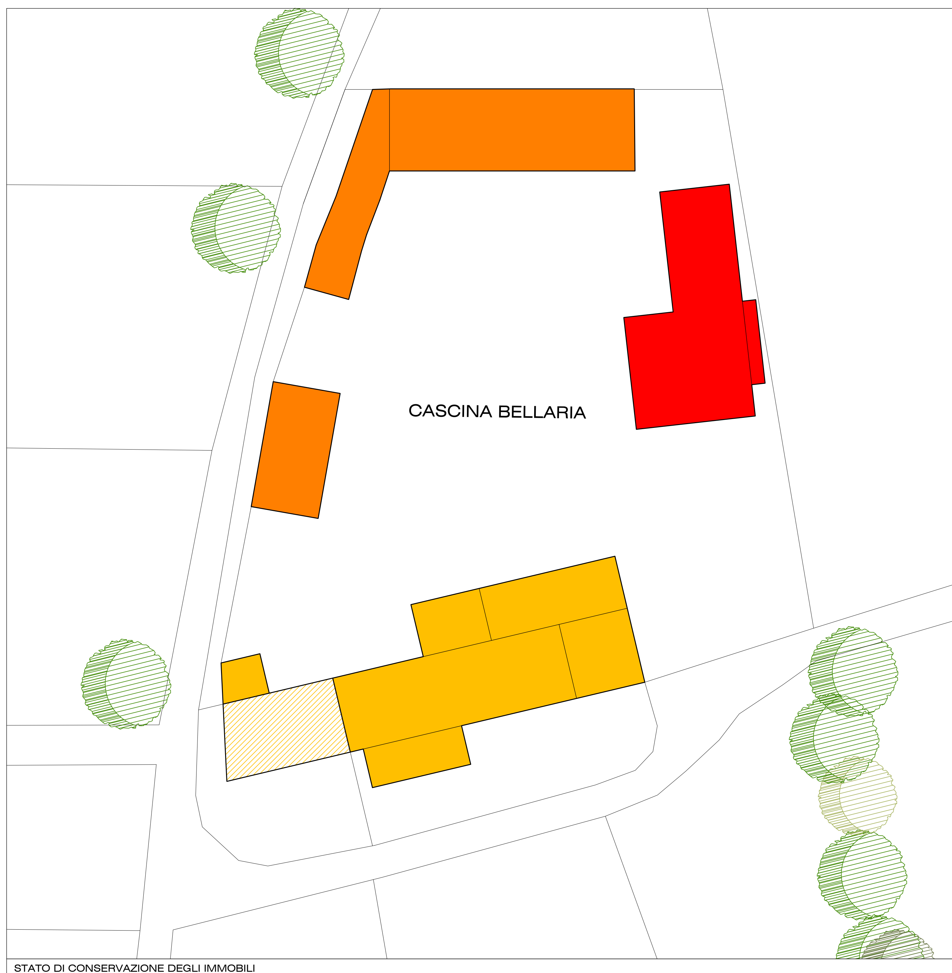
STATO DI CONSERVAZIONE DEGLI IMMOBILI